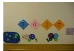
ユニット内の装飾